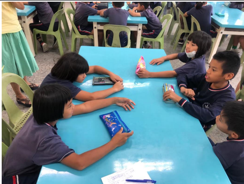
閱讀活動是分組進行的