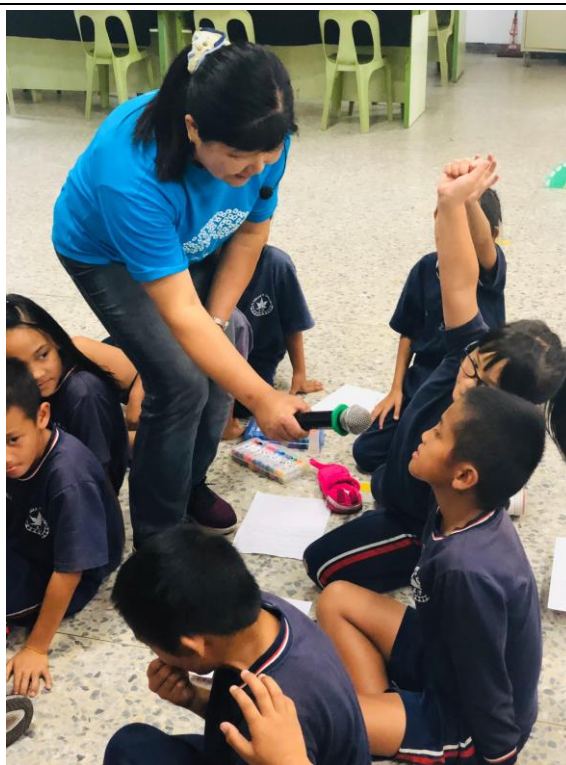
故事媽媽帶領著學生一起進行“歡喜閱讀”的活動