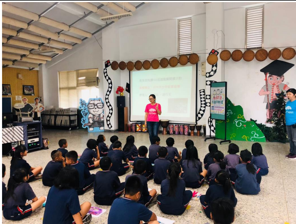
台中市故事媽媽協會到校進行說故事分享