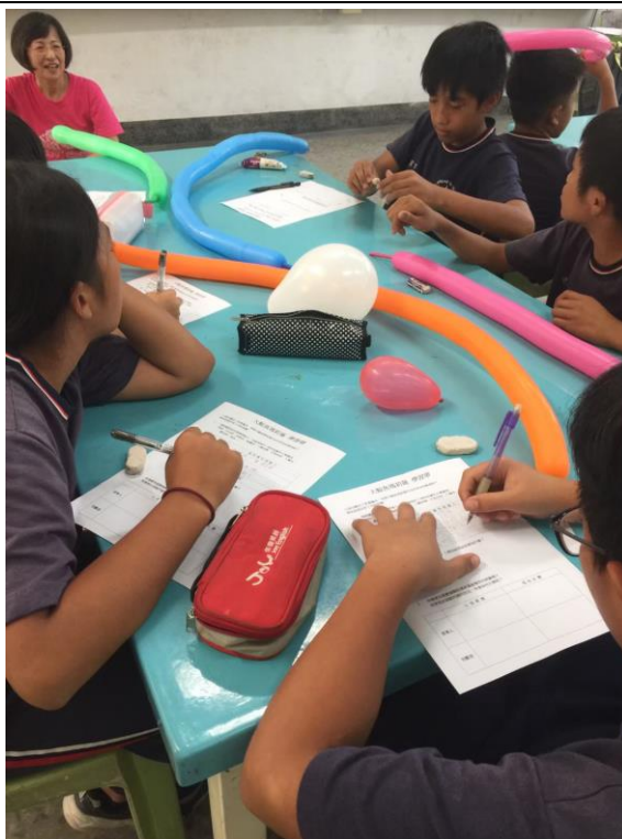
高年級的課程是較為進階的閱讀活動